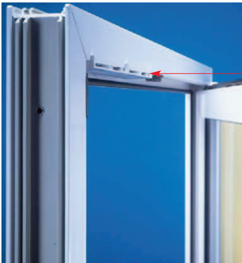
mit Fensterfalz-Lüfter (FL)

Es ist weder von innen noch von außen bei geschlossenem Fenster sichtbar und lässt sich mühelos reinigen.